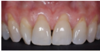
Figura 5. Depresión redondeada poco profunda con márgenes mal definidos, color más amarillento.

poco profundas, en lesiones más profundas se puede ver un tono marrón (Fig. 6).