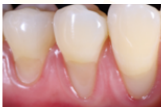
Figura 6. Hendiduras en forma de V y poco profundas.

La forma, tamaño, localización y color de las cavidades es un elemento diagnóstico de alto valor, ya que con esta información se puede determinar si la lesión cervical