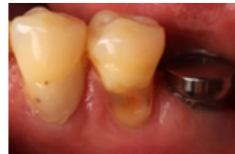
Figura 8. identificación de la lesión cervical no cariosa.

Se identifica la lesión cervical no cariosa (Fig. 8). Se realiza aislamiento absoluto con dique de goma (Browet & Gerdolle 2017), se arenó la superficie con óxido de aluminio de 50 micras para descontaminar la porción del diente que se va a restaurar (Klosa, Shahid, Aleknyonýtè-Resch & Kern 2020).