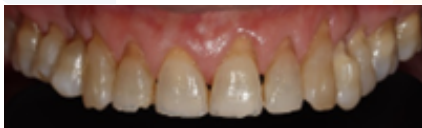
Figura 3. Lesión que afectan a cualquier diente, incisivos, caninos, premolares y molares.

Estas lesiones afectan a cualquier diente, incisivos, caninos, premolares y molares (Peumans, M., Politano, G., & Van Meerbeek, B. 2020). Cabe señalar que los premolares son los dientes más comúnmente afectados (Yang, J., Cai, D., Wang, F., He, D., Ma, L., Jin, Y., & Que, K. 2016), luego los molares, seguido por los caninos y por último los incisivos (Goodacre, Eugene Roberts & Munoz 2023) (Fig. 3).