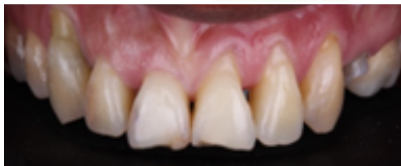
Figura 2. Lesión en el cuello del diente que exponen la raíz, pérdida de esmalte y dentina.

los malos hábitos de cepillado, una dieta con alimentos, bebidas y medicamentos ácidos, provocan que el desgaste avance más rápido y en consecuencia causa una lesión cervical no cariosa (Fig. 2).