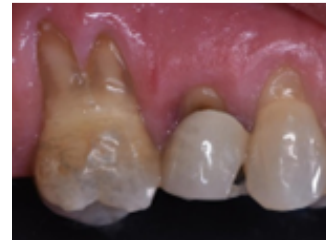
Figura 1. Retracción de la encía, daños a los tejidos blandos y provoca la exposición de la raíz, junto con la pérdida de hueso.

la pérdida de hueso, lo cual da un aspecto de un diente más largo y en algunos casos puede causar movilidad dental (Fig. 1).