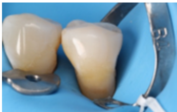
Figura 9. Colocación de resina compuesta en toda la lesión cervical no cariosa, se modela con resina del color del diente y se caracteriza con la misma textura.

y fotopolimerización con lámpara de fotocurado. Colocación de resina compuesta en toda la lesión cervical no cariosa, se modela con resina del color del diente y se caracteriza con la misma textura para evitar escalones o sobrecontornos. Finalmente se realiza protocolo de pulido y abrillantado (Fig. 9).