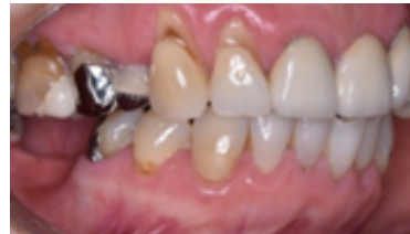
Figura 4. Se sitúan en su mayoría en las superficies faciales de los dientes.

Se sitúan en su mayoría en las superficies faciales de los dientes, rara vez se presenta en las superficies linguales o palatinas y todavía menos porcentaje en las zonas interproximales de los dientes (Fig. 4).